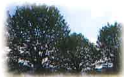
プラタナス 花言葉:好奇心